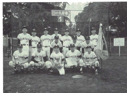
優勝の(株)きんでんナイン