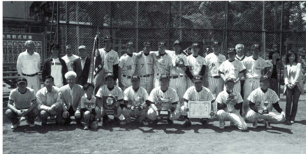
優勝 株式会社ユアテックチーム

(社)東京電業協会主催による第74回野球大会が日刊建設通信新聞社、日刊建設工業新聞社、日刊建設産業新聞社、電気新聞並びに電設工業健康保険組合の協賛により4月30日(日)から5月4日(木)迄の5日間にわたり明治神宮外苑軟式球場に於いて開催されました。