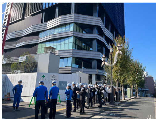
令和5年度見学会の様子