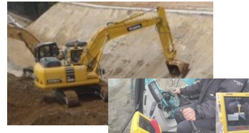
3) ICT建築土工 試行