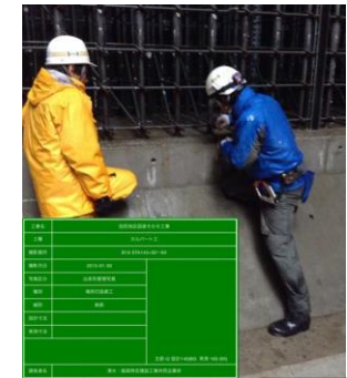
4) 電子小黒板 試行